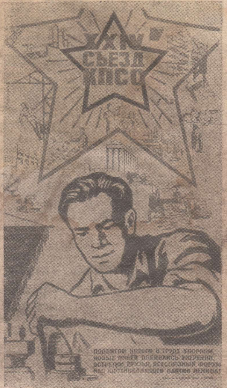
Плакат художника М. Соловьева, стихи А. Жарова, выпущенный издательством «Агитплакат» к XXIV съезду КПСС.

Подвигом новым в труде упорном, Новых побед добиваясь уверенно, Встретим, друзья, всесоюзный форум Нас вдохновляющей партии Ленина!